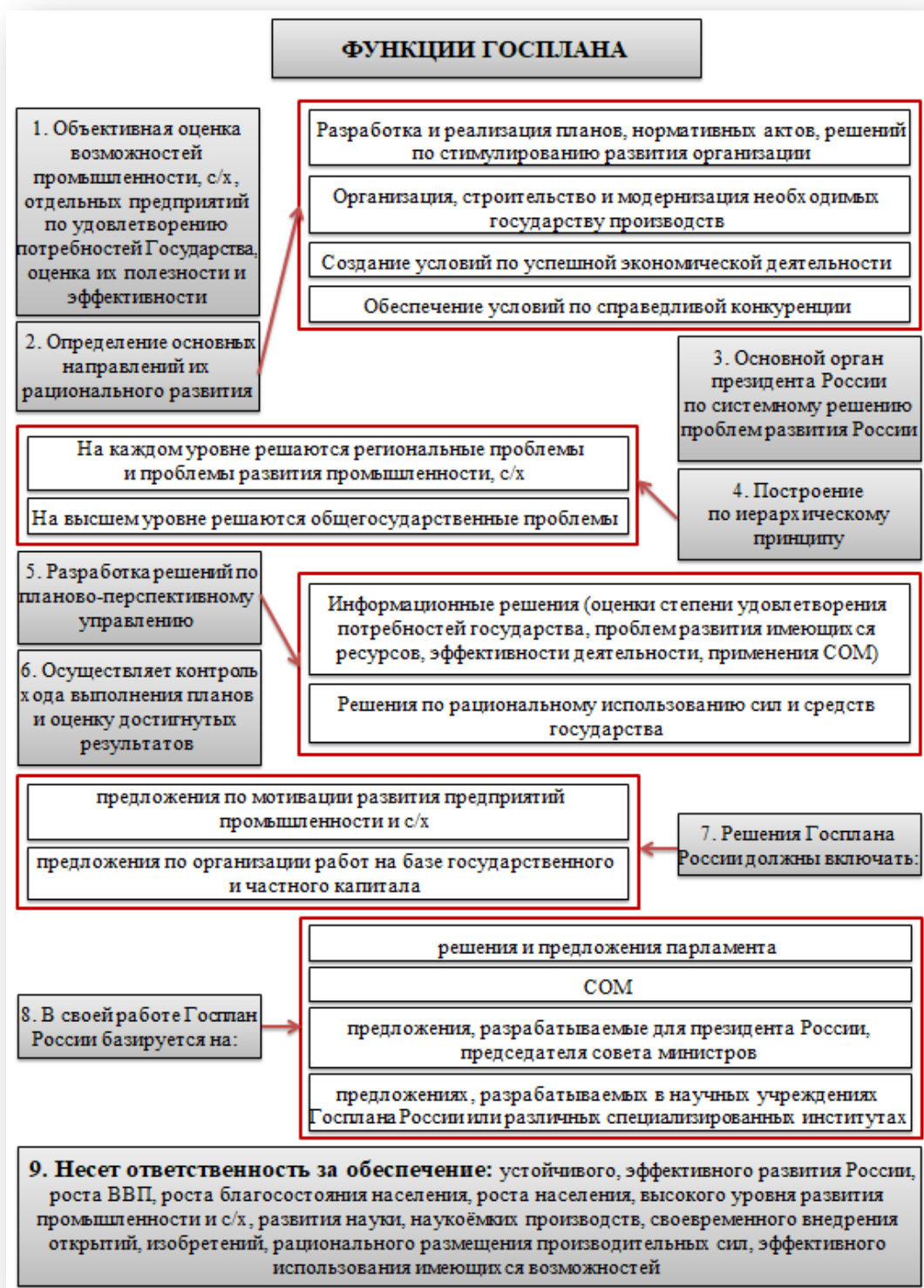
Рис. 11.2. Обязанности Госплана