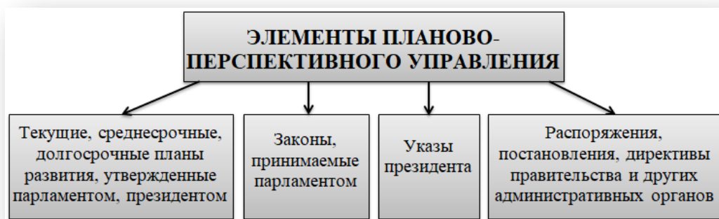
Рис. 11.1. Элементы планово-перспективного управления

Предположительно структура государственной системы планово-перспективного управления может включать: