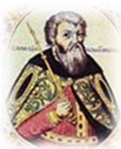
Всеволод III Юрьевич Большое Гнездо (1176–1212)

Пришел к власти в результате борьбы между Владимиром и Суздалем. Победил Владимир.