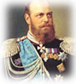
Александр III Александрович (Миротворец), император (1881–1894)

Возвысив дворянство, выхолостил суть реформ отца, Александра II.