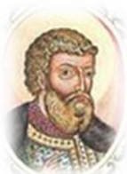
Мстислав I Владимирович Великий (1125–1132)

Прекратил смуты. Сторожил и охранял Русь. Строил города. Водворил суд и порядок. При нем на Руси установилась тишина. Разделил Русь между детьми и внуком.