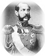
Александр II Николаевич, Освободитель, император (1855–1881)

Способствовал учреждению частных банков. Присоединил Кавказ и Туркестан. Освободил Балканы от турок в войне 1877–1878 гг. Присоединил к России части Армении и Бессарабии. Погиб в результате террористического акта.