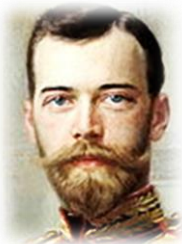
Николай II Александрович, император (1894–1917)

Реформа финансовой и налоговой систем привела к равновесию доходов и расходов государства. Провел выкуп железных дорог в казну. Открыл крестьянский банк. Ограничил компетенцию суда присяжных. Подчинил духовенству школы грамотности. Стеснил права евреев и иноверцев. Расширил границы России на юге. Восстановил военно-морской флот.