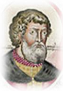
Всеволод II Ольгович (1139–1146)

Представитель ветви Ольговичей династии Рюриковичей. Сын Олега Святославича, внук великого князя киевского Святослава Ярославича (1073–1076). С 1127 г. княжил в Чернигове. В марте 1139 г., через месяц после смерти Ярополка Владимировича, сверг в Киеве его брата Вячеслава и занял великокняжеский престол.