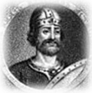
Изяслав II Мстиславич (1146–1154)

Потомок дома Мономаховичей. Захватил Киев, нарушив право старшинства своего дяди Юрия Долгорукого.