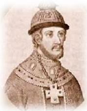
Царь Федор Иоаннович Блаженный (1584–1598)

Первым из государей принял на себя титул Царя. 13 лет правил с «избранной радой»: был созван земский собор и выпущен новый Судебник. Введена выборность местной власти. Воевал с боярами. Ввел опричнину и казни.