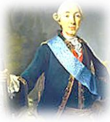
Петр III Федорович, император (1761–1762)

Внук Петра Великого. Освободил дворян от обязательной службы. Учредил Госбанк. Отрекся от престола в пользу своей супруги Екатерины.