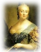
Елизавета Петровна, императрица (1741–1761)

Огромные средства выделялись из казны на обустройство царских резиденций – были выстроены Зимний дворец, Екатерининский дворец в Царском Селе, перестроены Стрельна, Петергоф.