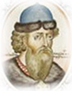
Владимир II Всеволодович (Мономах) (1113–1125)

Прекратил смуты. Сторожил и охранял Русь. Строил города. Водворил суд и порядок. При нем на Руси установилась тишина. Разделил Русь между детьми и внуком.