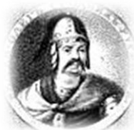
Вещий Олег (879–912)

Был родственником или соплеменником князя Рюрика, после смерти которого, в 879 г., стал княжить в Новгороде как опекун его малолетнего сына Игоря. В 882 г. пришел в Киев, убил тогдашних правителей города Аскольда и Дира и, объявив Киев «матерью городов русских», начал в нем править.