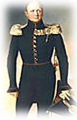
Александр I Павлович, Благословенный (1801–1825)

Выпустил указ о свободных землепашцах. Основал университеты в Петербурге, Казани и Харькове, Царскосельский лицей. Смягчил цензуру. Начал реформу управления: создал Госсовет.