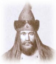
Василий I Димитриевич (1389–1425)

Продолжал дело собирания Руси покупкой ярлыков у хана. Перенес Владимирскую икону Божьей Матери в Москву. Отказался платить дань ханам. Отбивал нашествия татар. Оборонял Московскую Русь от Литовской, заключил мир.