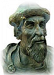
Ярослав I Мудрый (1019–1054)

В момент смерти Владимира находился в Киеве под стражей, вышел на свободу и вступил на престол. В ходе междоусобной войны убил братьев Бориса, Глеба и Святослава, но уже в 1016 г., после битвы под Любичем, был изгнан из Киева своим братом новгородским князем Ярославом Владимировичем (Мудрым).