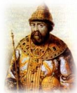
Царь Алексей Михайлович Тишайший (1645–1676)

Из-за тяжелых налогов случились мятежи в Москве, Новгороде и Пскове. Земский собор принял законы «Соборное Уложение». Раскол в церкви и обществе. Приняты в подданство Малороссия и Калмыкия. В войнах с Польшей возвращены России Смоленск, северские города. Основаны города в Сибири: Иркутск, Нерчинск. Народные волнения 1667–71 гг. под водительством Степана Разина принудили реорганизовать войско.