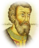
Василий II Васильевич Тёмный (1425–1462)

При Василии Дмитриевиче в Московском Кремле построены Благовещенский собор и Церковь Рождества Богородицы на Сениях.