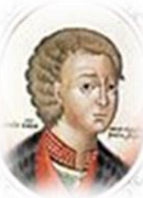
Юрий I Влади- мирович Долгорукий (1154–1157)

Потомок дома Мономаховичей. Захватил Киев, нарушив право старшинства своего дяди Юрия Долгорукого.