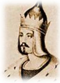
Изяслав I Ярославич (1054–1078)

Начал княжить в Киеве после смерти отца по его воле. При этом его братья получили княжение в других городах: Святослав – в Чернигове, Всеволод – в Переяславле, Игорь – во Владимире, Вячеслав – в Смоленске. В 1067 г. вместе с братьями Святославом и Всеволодом разбил полоцкого князя Всеслава Брючиславича в битве на Немиге, пленил его, привез в Киев и посадил в земляную тюрьму.