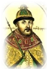
Царь Борис Федорович Годунов (1598–1605)

Развернулось небывалое строительство городов, крепостных сооружений. В 1585 г. была построена крепость Воронеж. Для обеспечения безопасности водного пути от Казани до Астрахани строились города на Волге – Самара (1586), Царицын (1589), Саратов (1590). В Сибири в 1604 г. был заложен город Томск. В период с 1596 по 1602 г. было построено одно из самых грандиозных архитектурных сооружений допетровской Руси – Смоленская крепостная стена.