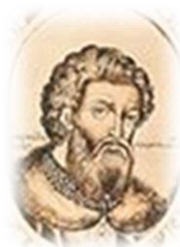
Александр Невский, святой (1246–1263)

После смерти отца вместе с братом Андреем отправился в столицу Монгольской империи – Каракорум, где Андрей получил ярлык на Владимир, а Александр – Киев и Новгород. Современные историки расходятся в оценке, кому из братьев принадлежало формальное старшинство. В Киев не поехал, оставшись в Новгороде. С 1252 года – великий князь Владимирский.