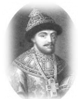
Царь Федор Алексеевич (1676–1682)

Из-за тяжелых налогов случились мятежи в Москве, Новгороде и Пскове. Земский собор принял законы «Соборное Уложение». Раскол в церкви и обществе. Приняты в подданство Малороссия и Калмыкия. В войнах с Польшей возвращены России Смоленск, северские города. Основаны города в Сибири: Иркутск, Нерчинск. Народные волнения 1667–71 гг. под водительством Степана Разина принудили реорганизовать войско.