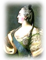
Екатерина II Великая, императрица (1762–1796)

Внук Петра Великого. Освободил дворян от обязательной службы. Учредил Госбанк. Отрекся от престола в пользу своей супруги Екатерины.