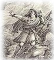
Святополк Окаянный (1015–1019)

В момент смерти Владимира находился в Киеве под стражей, вышел на свободу и вступил на престол. В ходе междоусобной войны убил братьев Бориса, Глеба и Святослава, но уже в 1016 г., после битвы под Любичем, был изгнан из Киева своим братом новгородским князем Ярославом Владимировичем (Мудрым).