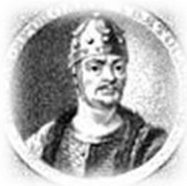
Ярополк I (972–980)

Начал править в Киеве после смерти отца, в то время как его братья Олег и Владимир начали править у древлян и в Новгороде, соответственно. В результате междоусобной войны с братьями в 977 г. стал единоличным правителем Древнерусского государства.