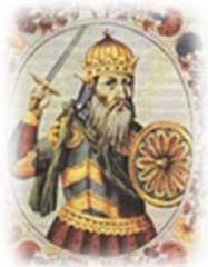
Святослав Игоревич (957–972)

Отомстила древлянам за мужа. Установила правильные дани. Приняла христианскую веру.