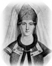
Елена Глинская (1533–1538) мать наследника престола Иоанна

После смерти мужа Елена Васильевна совершила переворот, отстранив от власти назначенных последней волей ее мужа опекунов, и сделалась правительницей Великого княжества Московского.