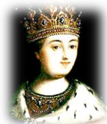
Правительница Софья Алексеевна (1682–1689), дочь царя Алексея

Софья пришла к власти, опираясь на своего фаворита Василия Голицына и стрельцов. Она стала регентшей при малолетних братьях Иване и Петре.