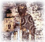
Ярослав II Всеволодович (1238–1246)

После смерти брата Юрия Ярослав явился из Киева, где княжил, в разоренный Владимир. Первым из русских князей получил ярлык на княжение от хана. С татарами не ссорился. Воевал с Литвой.