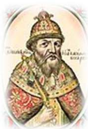
Царь Иван (Иоанн) IV Грозный (1533–1584) фактически правил с 1547 года