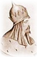
Мстислав II (1157–1159) (1167–1169)

Утвердил и укрепил Суздальское княжество. Основал Москву, Юрьев, Звенигород. Боролся с Изяславом за Киев.