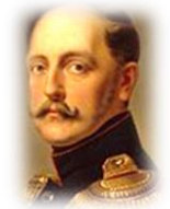
Николай I Павлович, император (1825–1855)

Вел Отечественную войну 1812 года с Наполеоном. Освободил Европу от Наполеона.