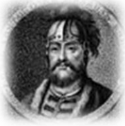
Святополк II Изяславич (1093–1113)

Сын Изяслава I Ярославича. На момент смерти отца, в 1078 г., княжил в Новгороде, а в 1088 г., при своем дяде Всеволоде I Ярославиче, перешел в Туров, где и правил до 1093 г. В момент смерти великого князя Всеволода I рядом с ним находился его сын Владимир II, который мог занять великокняжеский престол, но, не желая войны, добровольно уступил это право двоюродному брату Святополку.