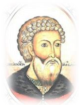
Иоанн III Васильевич (1462–1505)

Продолжил дело собирания Руси: подчинил Москве Новгород, Тверь, Верею, часть Рязани. В княжение Иоанна III: свергнуто татарское иго; принят Судебник; утвержден герб России с двуглавым орлом; стал использоваться титул царя; заложены основы самодержавия.