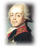
Павел I Петрович, император (1796–1801)

Присоединила: Крым, Кахетию, Курляндию, Белоруссию, Волынь.