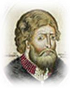
Ярополк II Владимирович (1132–1138)

Распад Древнерусского государства на самостоятельные княжества часто датируется годом смерти Мстислава I Великого. Власть киевских князей перестали признавать другие русские княжества, а сам титул стал объектом борьбы между различными династическими и территориальными объединениями Рюриковичей.