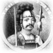
Игорь Рюрикович (912–945)

Ходил на Византию. Заключил договор с греками. Обложил древлян тяжелой данью, за что был казнен.